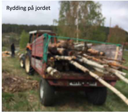
Rydding på jorden