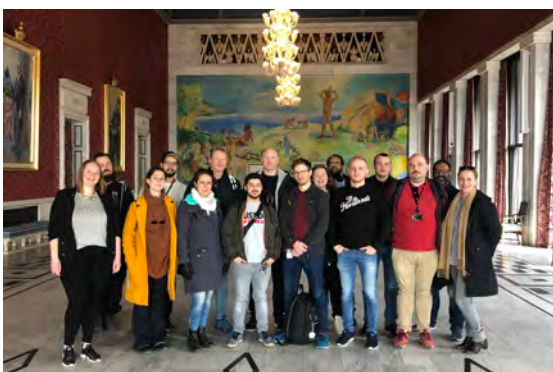
«Tillitsvalgte på Fase 1 kurs i Oslo Rådhus»

Under bolken om 3-part samarbeid og partene i arbeidslivet, valgte vi å kombinere dette med et besøk på Oslo Rådhus. Her fikk vi omvisning av en av bystyrets representanter samt en egen omvisning i Rådhuset av Rådhusets egne omvisere. Selv om begge deler var interessante og faglig relevante ble det mye med så mange timer. Dette justeres i kommende periode.