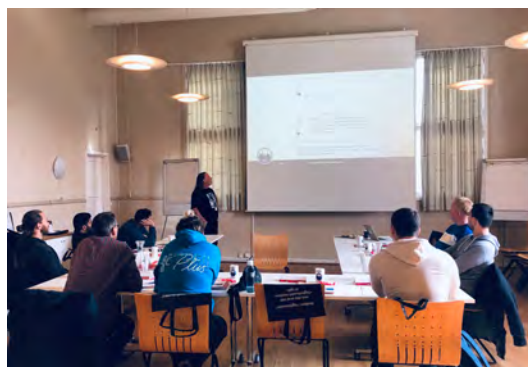
«Medlemmer på Introkurs i Sangerhallen»