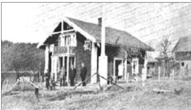
Hovedbygningen på Herøya før ombygningen.

De siste årene har etterspørsel gjort at boenheter og lokaler/områder også leies ut til arrangementer. Det kan arrangeres for opptil 200 personer ved leir, lokalene har plass for opp til 100 personer.