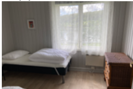
Eksempel på rom