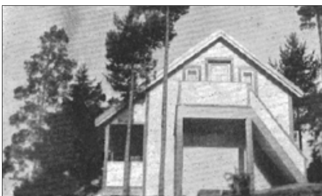
Den første hytta som ble oppført på Herøya.