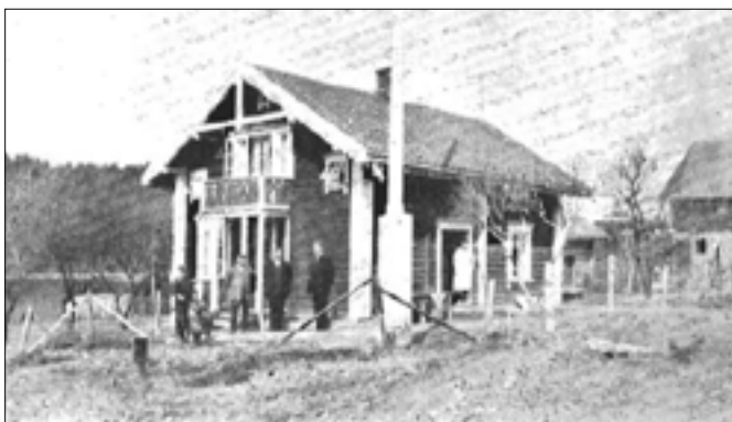
Hovedbygningen på Herøya før ombygningen.