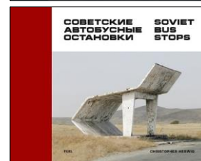
Over: Første bok med bilde fra Taraz, Kasakhstan.