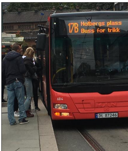
17B erstatter trikk 11, 17 og 18, her fra Jernbanetorget, retning nord.