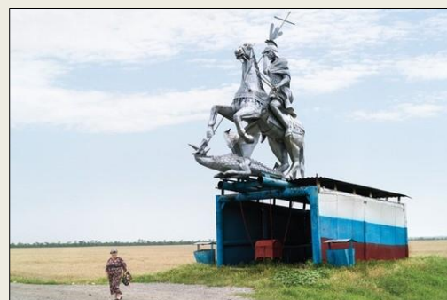
Bussholdeplassutsmykning utover det vi er vant til. Fra Rostovanovskoye, Russland.