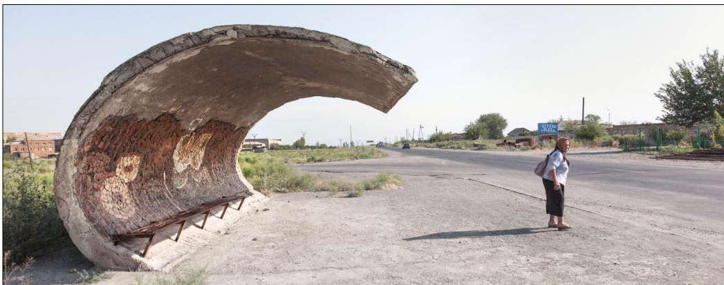
KOMMER BUSSEN SNART? Et ikke helt utypisk gammelt sovjetisk busstopp i Echmiadzin, Armenia.